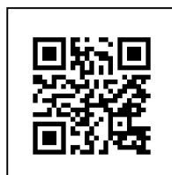
表1、表2のカリキュラムについて、詳細は、 右記のQRコードを使用し、カリキュラム内容、受講料など ご確認よろしくお願い致します。